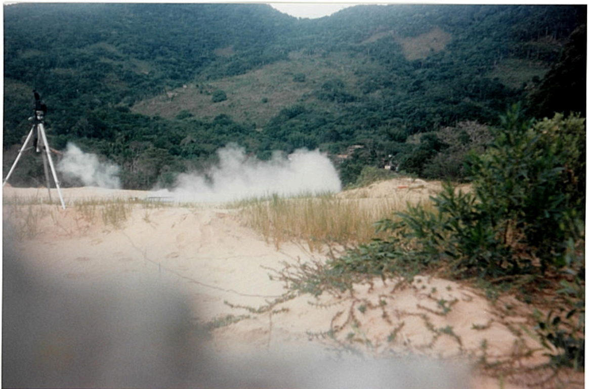
Foto 6. MF Netuno-R durante o TE-29.