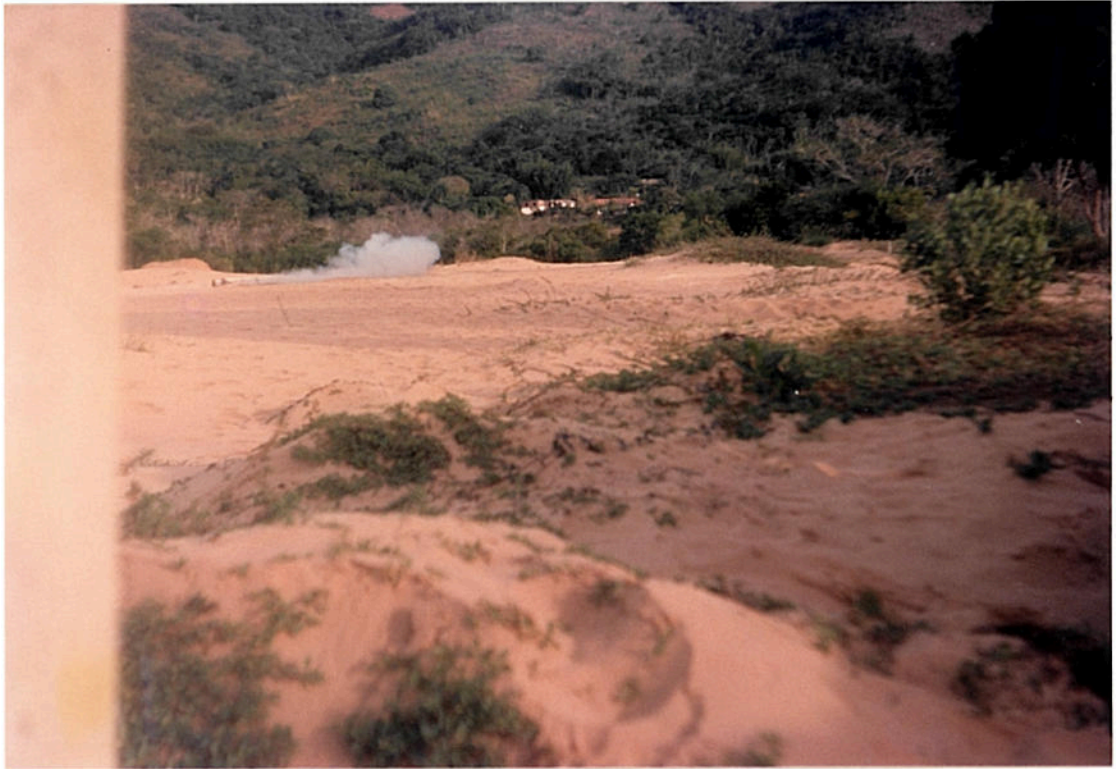
Foto 3. MF Netuno-R com tubeira convergente-longa durante o TE-10.