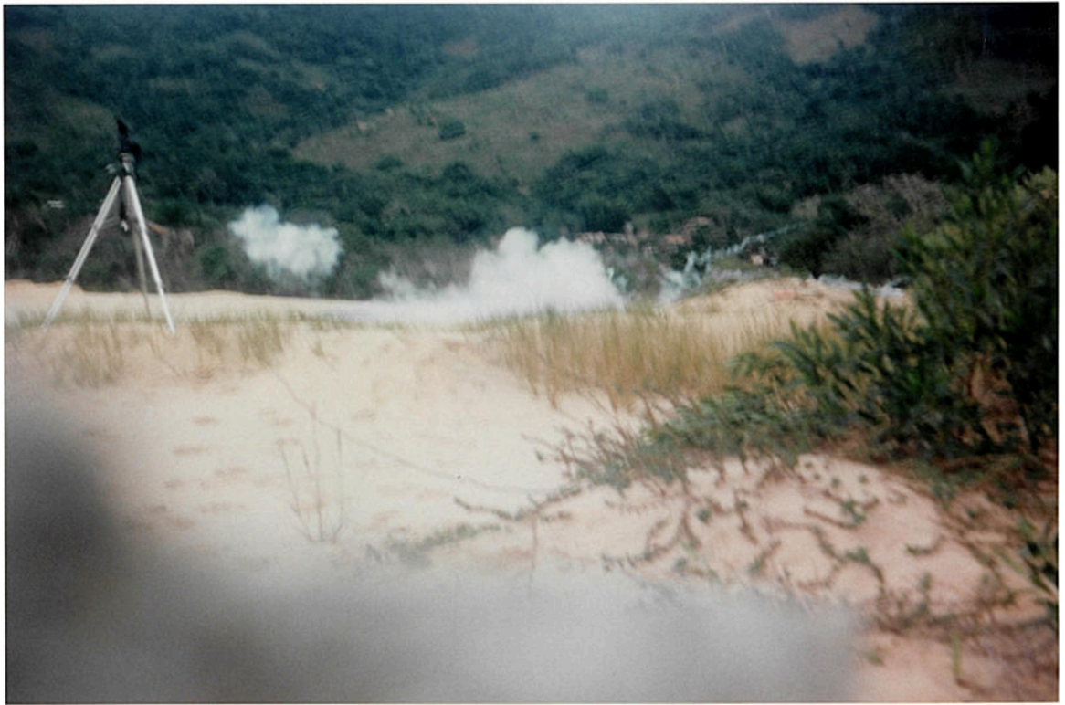
Foto 7. MF Netuno-R durante o TE-30.