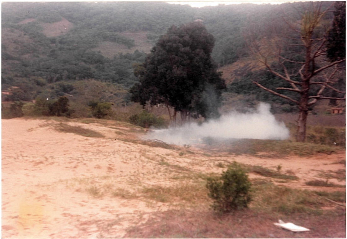
Foto 5. MF Netuno-R com tubeira convencional durante o TE-16.