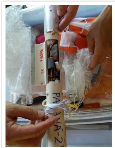
Seção da placa eletrônica da cápsula Paraná-29 com bateria e 4 altímetros.