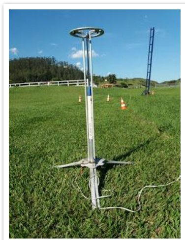
O minifoguete Netuno-F/Paraná-29 em sua rampa momentos antes do seu lançamento.