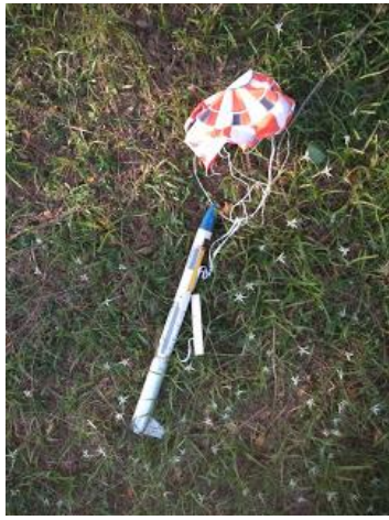
O minifoguete Netuno-F/Paraná-29 logo após o seu voo mostrando o paraquedas e a janela de ejeção aberta.