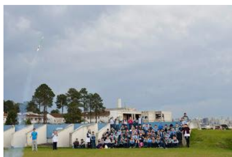
Minifoguete em voo propulsado.

Agradeço à equipe do GFCS que colaborou no evento: Filipe Aguiar, Tobias Queluz, Ruven Wang, Phillippe Rosa (vídeos) e Thiago Quevedo (fotos).