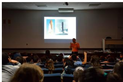
Palestra sobre foguetes e minifoguetes na UFPR.