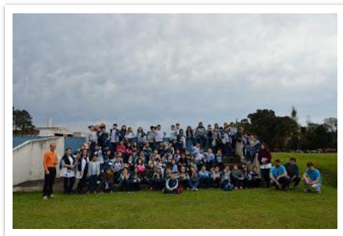
Alunos do ensino fundamental visitando o GFCS na UFPR.

Algumas fotos sobre o evento são apresentadas abaixo.