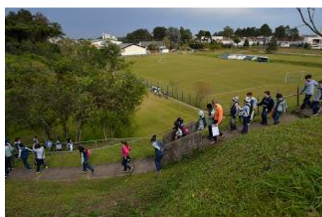
Alunos a caminho do local dos lançamentos dos minifoguetes na UFPR.