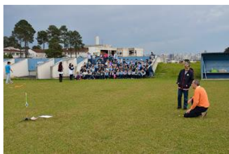
Minifoguete preparado para lançamento.