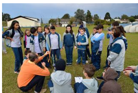
Explicação sobre os procedimentos de lançamento de um minifoguete.