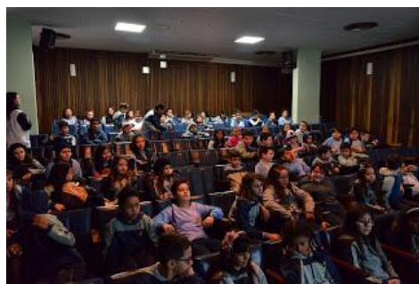
Alunos durante a palestra na UFPR.