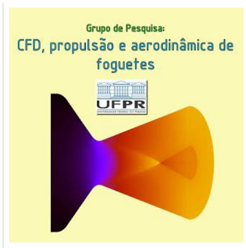
Logo do grupo de CFD da UFPR (Diego F. Moro).